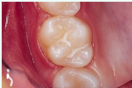
Schutz vor Karies: Versiegelung der feinen Grübchen auf der Kaufläche

Bei der Versiegelung werden die Fissuren mit einem hellen Kunststoff dauerhaft verschlossen, so dass an diesen Stellen keine Karies mehr entstehen kann (siehe Abb. unten).