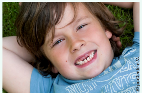
Bei der Prophylaxe lernen Ihre Kinder die richtige Zahnpflege

Es gibt also keinen Grund, warum Sie auf Prophylaxe für Ihre Kinder verzichten sollten.