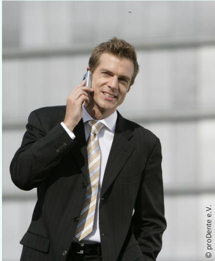
Selbstsicher mit gepflegten Zähnen

Dann werden Mund, Zähne und Zahnfleisch untersucht. Die Zahnbeläge werden angefärbt, um sie besser sichtbar zu machen und es wird die Tiefe der Zahnfleischtaschen gemessen.