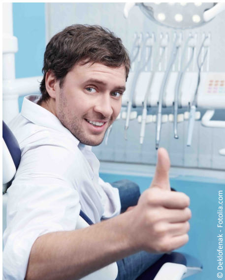
Gesunde Zähne in jedem Lebensalter dank regelmäßiger Professioneller Zahnreinigung