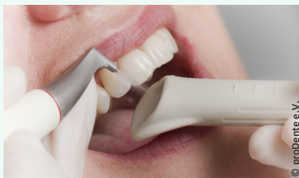
Zahnreinigung mit Pulverstrahlgerät

Auch wer seine Zähne regelmäßig und sorgfältig putzt, erreicht nicht alle Zahnoberflächen. Das sind vor allem die Stellen unter dem Zahnfleisch, in manchen Zahnzwischenräumen und die sehr feinen Grübchen auf den Kauflächen.