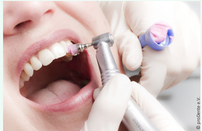
Die Professionelle Zahnreinigung wird von speziell ausgebildeten Prophylaxe-Fachkräften ausgeführt und ist eine lohnende Investition in die eigene Gesundheit.

Sie ersparen sich oft Kronen, Implantate und Zahnfleischoperationen.“