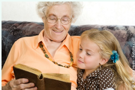
Sicher und unbefangen sprechen mit gut sitzenden Zähnen

Menschen jeden Alters wollen heutzutage aktiv am Leben teilnehmen: In ihrer Familie, im Freundeskreis und bei gesellschaftlichen Anlässen. Dazu gehört auch, dass man sich sicher fühlt beim Essen, Reden und Lachen.