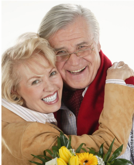
Mehr Lebensfreude und Sicherheit mit Implantaten