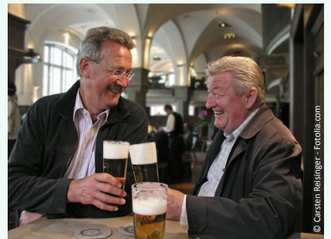
Fest sitzende Zähne: Ein gutes Gefühl!

Stellen Sie sich vor, wie es ist, wenn Sie wieder kraftvoll abbeißen und gut kauen können. Freuen Sie sich an Ihrer neu gewonnenen Sicherheit im Umgang mit anderen Menschen.