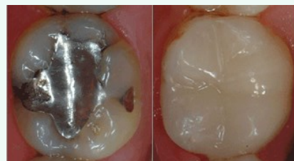
Bedenkliches Amalgam (links) oder verträgliche und ästhetische Füllungen aus Komposit oder Keramik (rechts)?

Als Kassenpatient haben Sie die Wahl zwischen Amalgam und kurzlebigen Kunststoff-Füllungen. Wenn Sie eine dauerhaftere und schönere Lösung wollen, sollten Sie sich für Kompositfüllungen oder für Keramikinlays entscheiden.