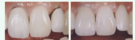
Metallkeramik-Kronen mit dunklen Rändern (links) und ästhetische Kronen aus reiner Keramik (rechts).

Wenn Sie wirklich schöne Zähne wollen, sollten Sie sich für Kronen und Brücken aus reiner Keramik entscheiden.